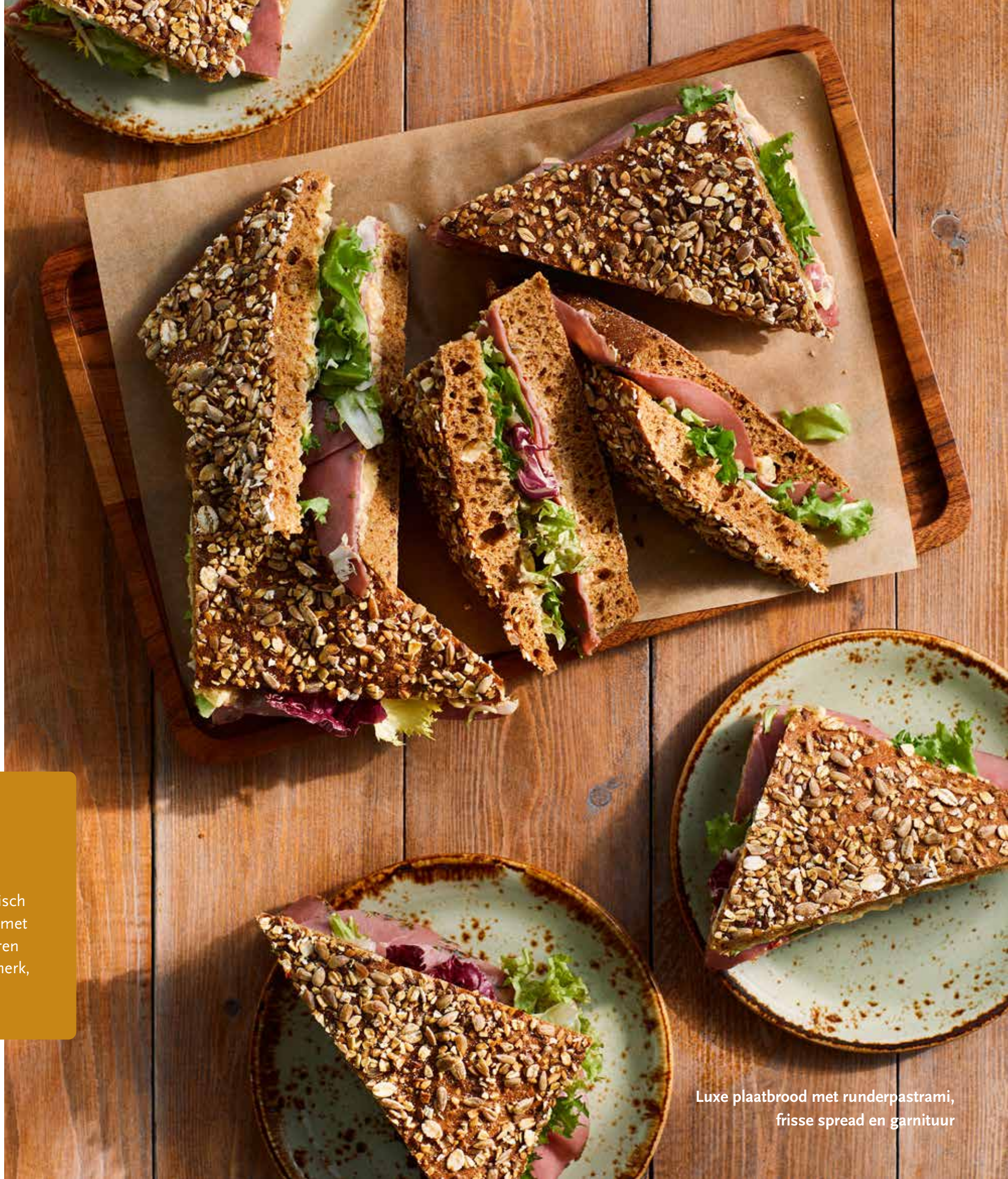
Luxe plaatbrood met runderpastrami, frisse spread en garnituur

In ons horeca-assortiment vindt u voor elk wat wils. Of u nu halal, vegetarisch of veganistisch eet of juist van vlees houdt, wij selecteren onze producten met zorg. Waar mogelijk, werken we met producten uit het seizoen. Ook serveren we op al onze locaties kraanwater, koffie met het Rainforest Alliance-keurmerk, biologische thee en biologische wijn.