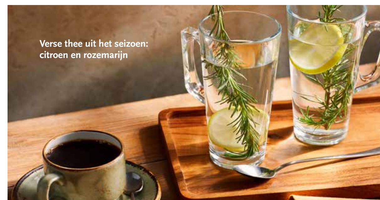
Verse thee uit het seizoen: citroen en rozemarijn

* Te bestellen vanaf 10 personen en alleen voor aanvang van de dienst. De prijs is per persoon per 30 min.