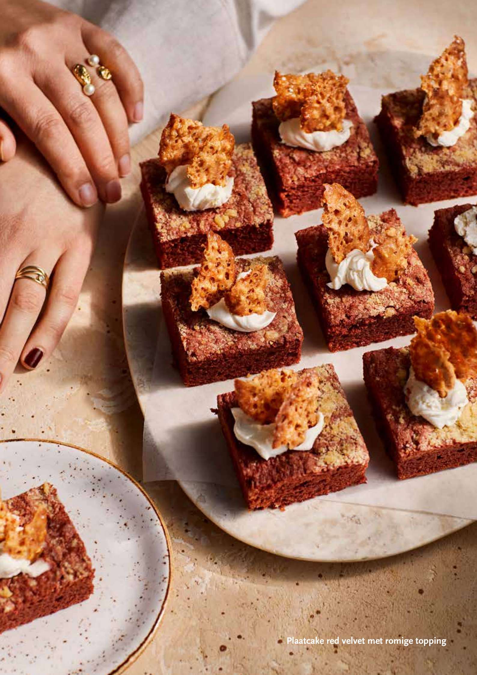
Plaatcake red velvet met romige topping