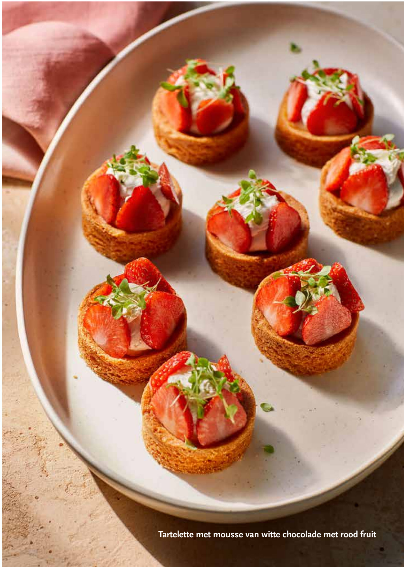
Tartelette met mousse van witte chocolade met rood fruit