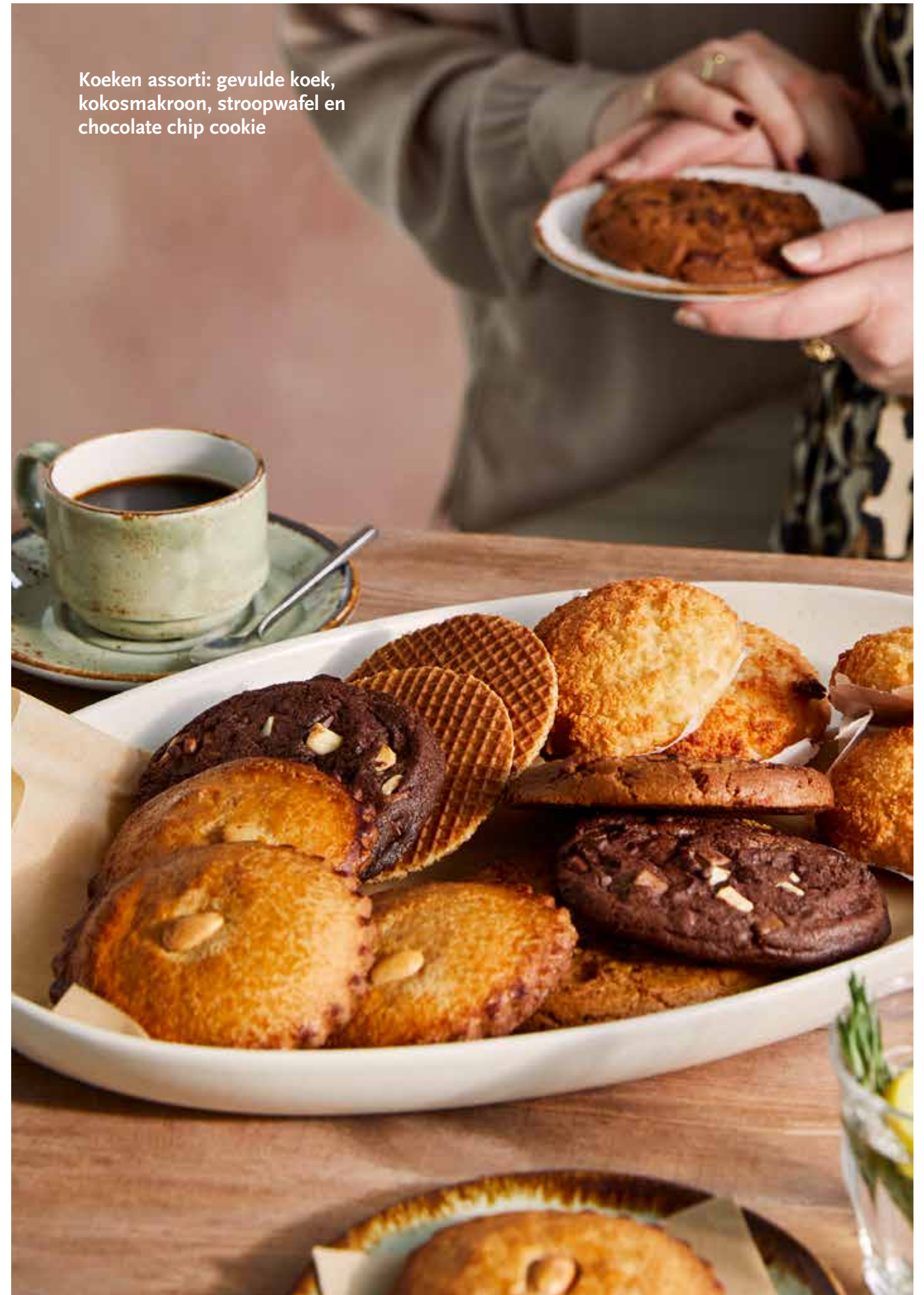
Koeken assorti: gevulde koek, kokosmakroon, stroopwafel en chocolate chip cookie