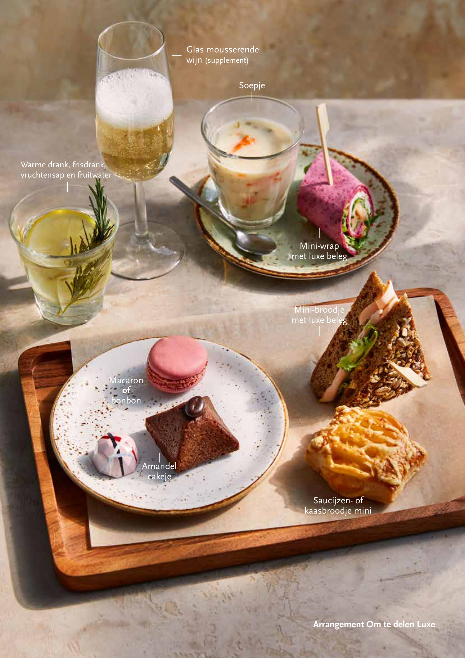
Glas mousserende wijn (supplement)